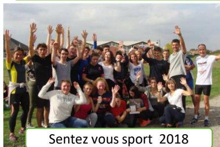
Sentez vous sport 2018

« L'élève est à l'initiative et acteur du projet : il y développe curiosité, responsabilité, esprit de groupes et autonomie . Son implication contribue largement à sa réussite scolaire .