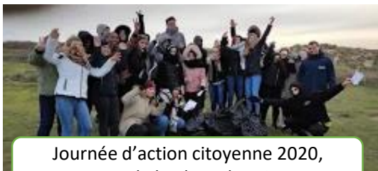
Journée d'action citoyenne 2020, nettoyage de la plage de Wimereux