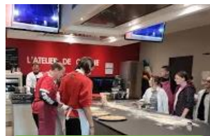
Ateliers culinaires 2020 Et du fait maison