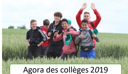
Agora des collèges 2019

Le label ECO-ECOLE est un programme international d'éducation au développement durable qui contribue aux objectifs fixés par l'ONU