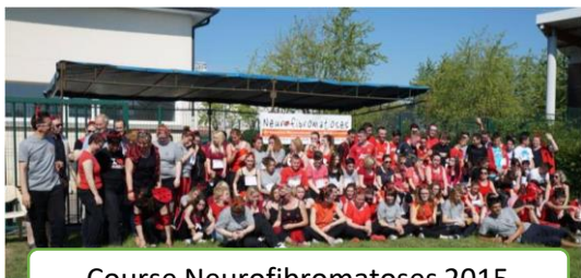
Course Neurofibromatoses 2015

Intégré dans son CV, ces expériences favorisent son insertion professionnelle »